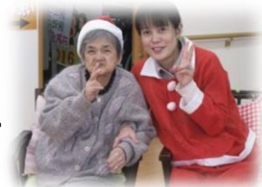
サンタからのプレゼントはあったかな?