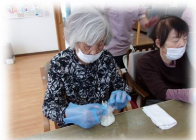
牡丹餅作りに集中しています。丸める作業もお手のもの(#^.^#)